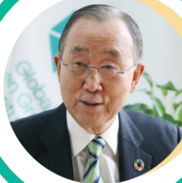
H.E. Ban Ki-moon President of the Assembly & Chair of the Council and 8th Secretary- General of the United Nations

UN CONSEILLER DE CONFIANCE ET UN PARTENAIRE DE DÉVELOPPEMENT INTÉGRÉ DANS LES GOUVERNEMENTS MEMBRES ET PARTENAIRES